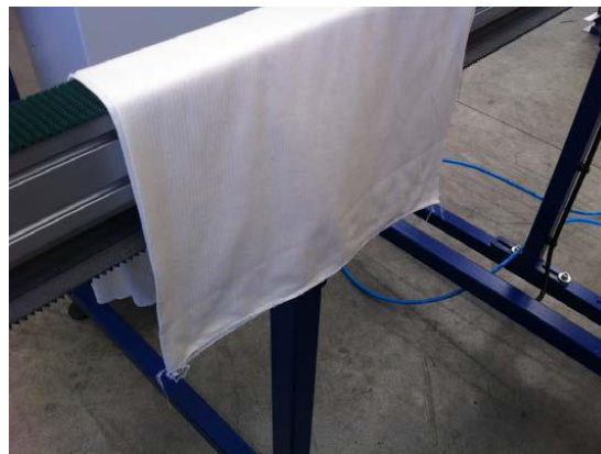
Enrata / Entrada